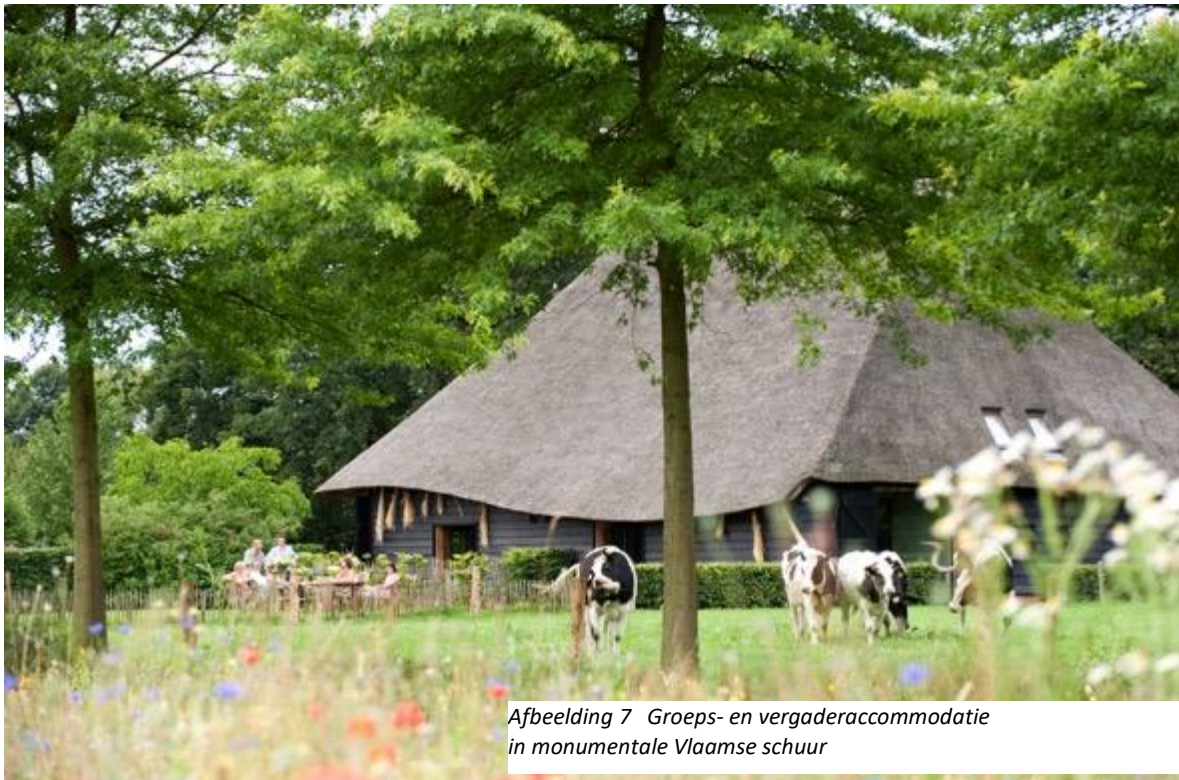
Afbeelding 7 Groeps- en vergaderaccommodatie in monumentale Vlaamse schuur