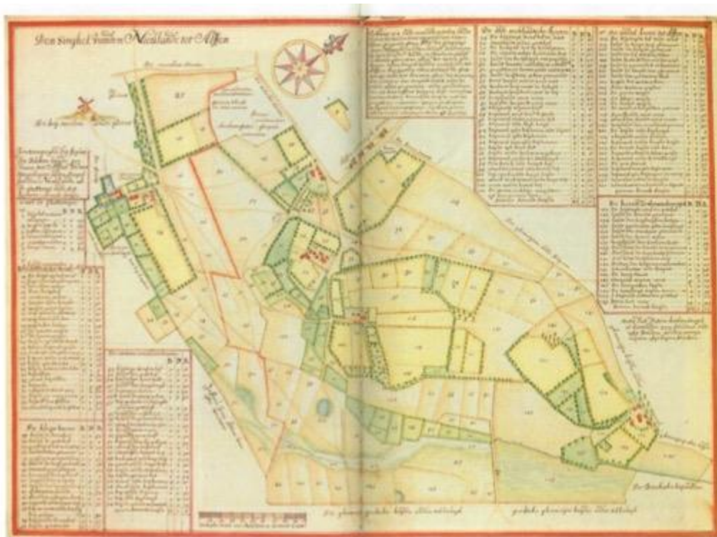
Afbeelding 1 Landkaart Singel van de Nieuweland (1714)

De geschreven geschiedenis van De Hoevens begint echter in 1204, wanneer de Nieuwelandse Hoeve door de Heer van Breda aan de Abdij van Tongerlo wordt geschonken. Het jaar daarop volgt het Hof ter Zande op Kwaalburg en in 1216 krijgt de abdij van de Heer van Breda als derde hoeve De Leeuwkeneik geschonken. Veel later pas, in de 16 e eeuw, volgen de Pastoriehoeve en de Kleine hoeve en in 1622 de Middelhoeve, die later Grote Hoeve heet. Deze hoevens worden allemaal door de Norbertijnen ontgonnen en met pachters bezet. Zo'n pachtcontract kende vele verplichtingen. Verplichtingen met betrekking tot het inrichten en beheren van zo'n hoeve, maar ook verplichtingen betreffende hand- en spandiensten voor het overig abdijbezit, zoals voor de kerk van Alphen. Een pachtcontract werd meestal afgesloten voor 6 jaar telkens vanaf half maart, en kende een vast pachtbedrag in geld, het zogenaamde "voorlijf". Daarnaast ook huur dat moest worden voldaan met graan, zaad, was, boter en kaas. Pachters hadden het niet altijd gemakkelijk. Niet alleen door oorlogen en plunderingen (Maarten van Rossum, Spaanse leger) maar ook door misoogsten en persoonlijk leed zoals de pest en vroege sterfte van de pachter. Op een fraaie landkaart van de Singel van de Nieuwelande uit 1714 kun je zien hoe welvarend de pastorie en de 6 hoeven van Tongerlo er toen bij lagen!