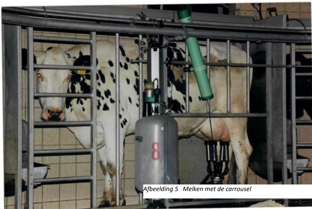
Afbeelding 5 Melken met de carrousel