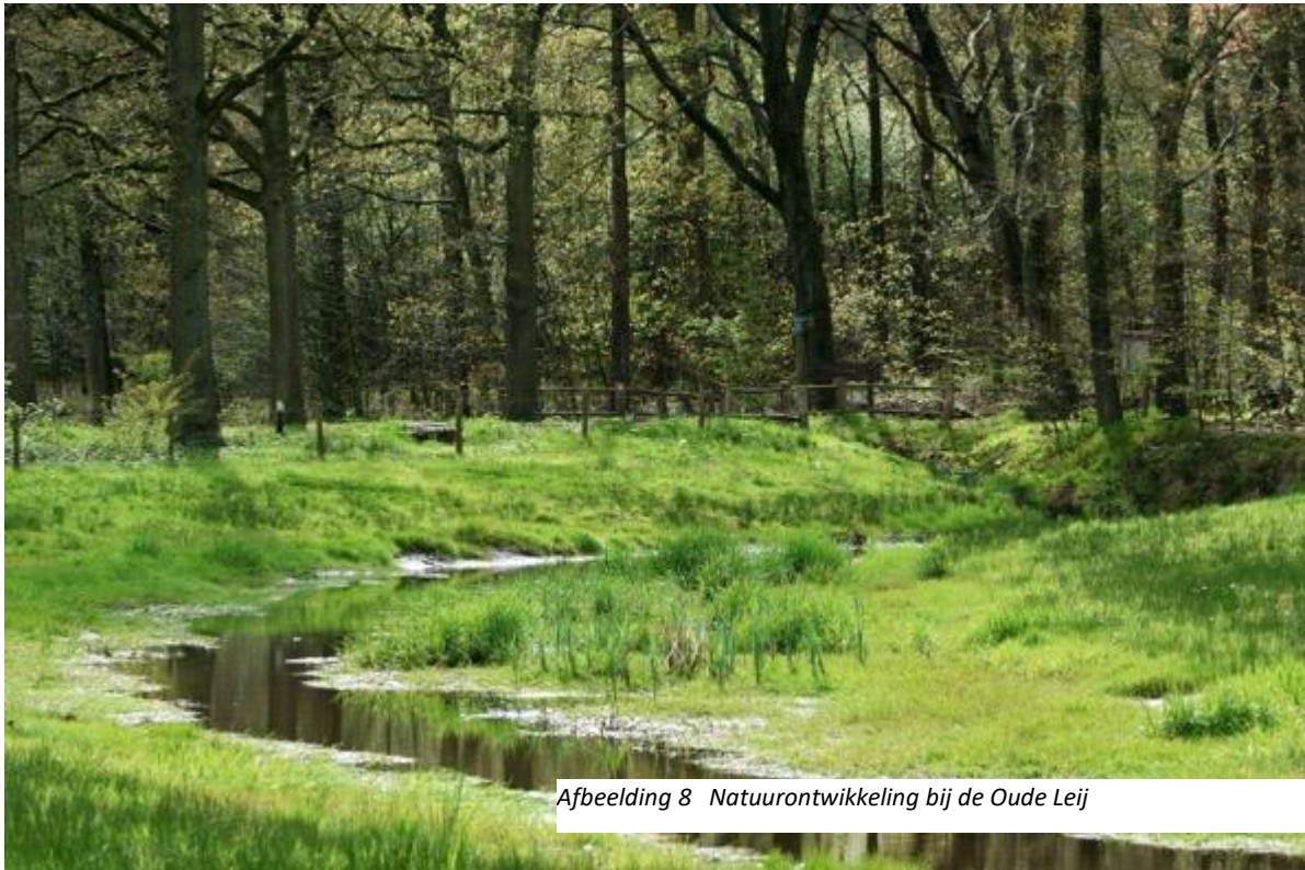
Afbeelding 8 Natuurontwikkeling bij de Oude Leij