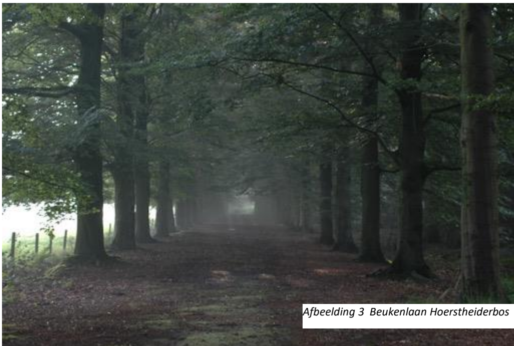
Afbeelding 3 Beukenlaan Hoerstheiderbos

In opdracht van Henri en Joseph Blomjous wordt in 1920 op De Hoevens een bescheiden buitenplaats gesticht als centrum van een nieuw modern landgoedbedrijf. De centraal gelegen Grote Hoef wordt omgevormd tot buitenverblijf. De befaamde Tilburgse architect Jan van der Valk krijgt de opdracht om de Grote Hoef om te bouwen tot 'Villa De Hoevens'. Daarbij blijft de schoonheid van de boerderij, een monument op zich, in zijn eenvoud bewaard. Wel wordt een eigentijdse jachtkamer (stijl van de Amsterdamse school) in een hoek van 45 graden aan de bestaande bebouwing gebouwd met prachtige uitzichten op de omliggende landerijen. Ook wordt op de plek van de Hoerstheide, aan de zuidoostzijde, het Hoerstheiderbos aangelegd. Met brede geometrische wandellanen, aangeplant met groene beuken. De rode beukenlaan is bewust geplant om zo een markant contrast en achtergrond te creëren voor de westelijk gelegen landbouwgronden.