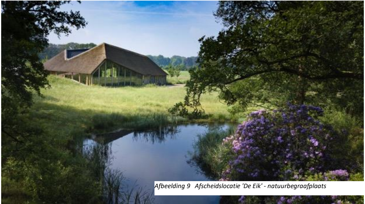
Afbeelding 9 Afscheidlocatie 'De Eik' - natuurbegraafplaats

Inmiddels zijn er 4 kinderen geboren in het gezin Van der Lande-Vogels. Floris en Caroline zijn sterk verbonden met De Hoevens en het lijkt hen een mooie gedachte om ooit op het landgoed begraven te worden. Tijdens een gesprek met de gemeente Goirle komt het idee op tafel. In 2009 krijgen ze toestemming voor een familie-begraafplaats op het landgoed. Tijdens een wandelvakantie in Engeland doen ze een jaar later inspiratie op. Voor de aanleg van de natuurbegraafplaats worden voormalige landbouwgronden teruggegeven aan de natuur, worden 5200 vierkante meter aan bedrijfsgebouwen afgebroken en wordt een landschapsplan ontwikkeld. Van de voormalige kalverstal wordt een informatiecentrum gemaakt. En er wordt een prachtige afscheidlocatie gerealiseerd. Na jaren van voorbereiding wordt in 2014 de natuurbegraafplaats geopend.