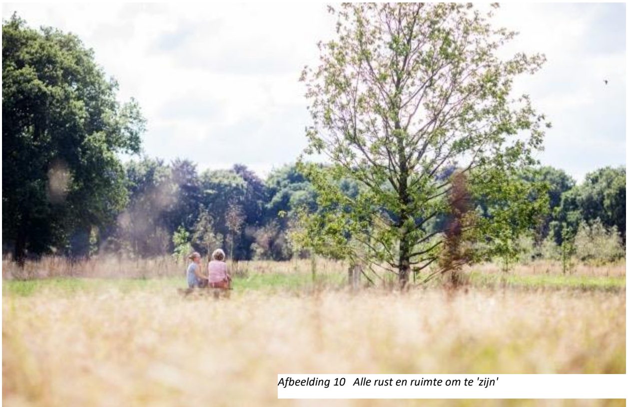
Afbeelding 10 Alle rust en ruimte om te 'zijn'